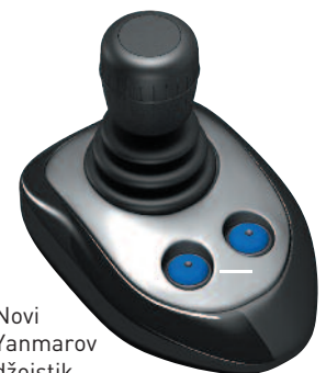
Novi Yanmarov džojstik

Želite li doživjeti ultraglatko manevriranje motornom jahtom? Yanmar je razvio sofisticiran i jedinstven sustav upravljanja pomoću dvaju krmenih pogona povezan s dva Yanmar 8-cilindarska 8LV320, 350 ili 370 KS dizelska motora. Više nema potrebe za pramčanim propelerom. Upravljanje i manevriranje motornom jahtom sada se postiže blagim dodiranjem prstiju. Vrlo prilagodljiv software odabire najbolju poziciju krmenih pogona, što rezultira naprednom logikom upravljanja. Važno je znati da su spojke hidraulične, što osigurava nisku razinu buke i vibracija. Nautički profesionalci tvrde da je Yanmarov sustav najbolji sustav upravljanja džojsti-