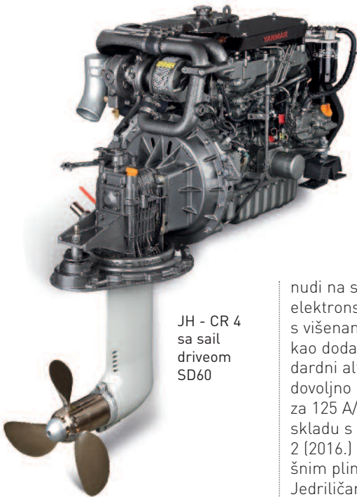
JH - CR 4 sa sail driveom SD60

N avela, dugogodišnji zastupnik Yanmara za Hrvatsku, Bosnu i Hercegovinu, Srbiju, Crnu Goru, Sloveniju i Albaniju ove će godine svojim klijentima ponuditi čitav niz novih proizvoda japanskog proizvođača. Neke od njih vidjet će i posjetitelji zagrebačkog Sajma nautike koji se održava od 19. do 23. veljače.